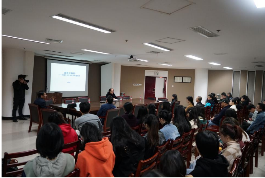
美育大讲堂：国家画院张晓凌教授讲座