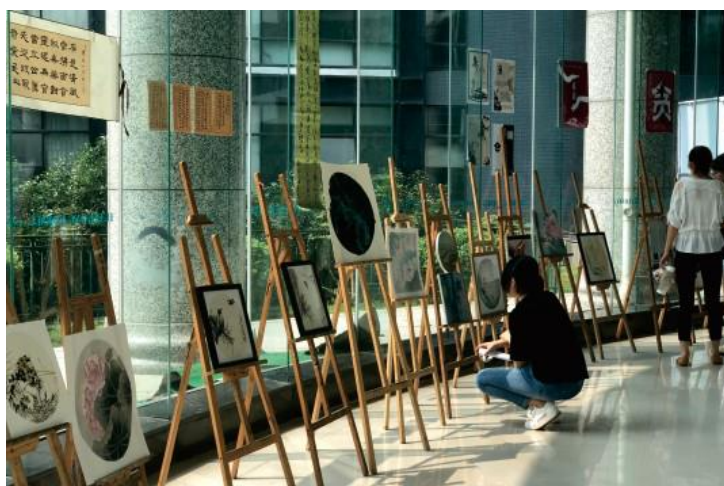
笔尖上的廉政课：廉政文化作品大赛

“美育大讲坛”是华中师范大学推进美育工作的品牌活动之一，以美术学院为主办方，邀请校内外知名美学、美育专家谈美，定期进行讲座活动。内容既有深入人心的理论课堂，又有艺术家现场示范并结合理论讲解的课堂。通过美育大讲坛的系列活动，师生共同深入探