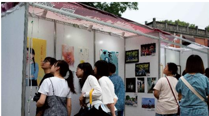
博雅原创优秀作品展

“美术进社会”是美育节系列活动的延伸与拓展，旨在让艺术走进大众，为社会提供服务，建设社会主义精神文明和培养学生向上向善的美德。通过手绘军运会武汉体育中心作品展、美院优秀作品进附小作品展、“共赏一次美术展”主题团日活动和艺术走基层系列展览，让广大市民、在校大学生及广大中小学生，近距离感受美，欣赏美，理解美。活动中展出的作品均为美术学院学子原创，作品的形式包括油画、版画、国画等，共计 200 多幅，得到了众多观众的喜爱，获得了良好的社会反响，也为提高社会的审美素质贡献了一份力量。