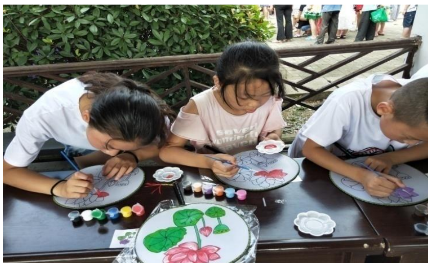
实践队员教小学生画荷花