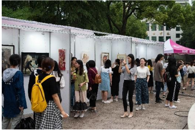
博雅原创美术作品展