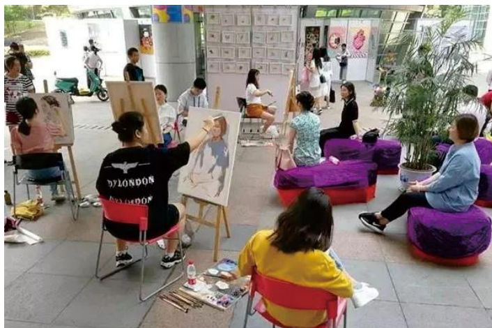
行走的思政课：为最美教师画像