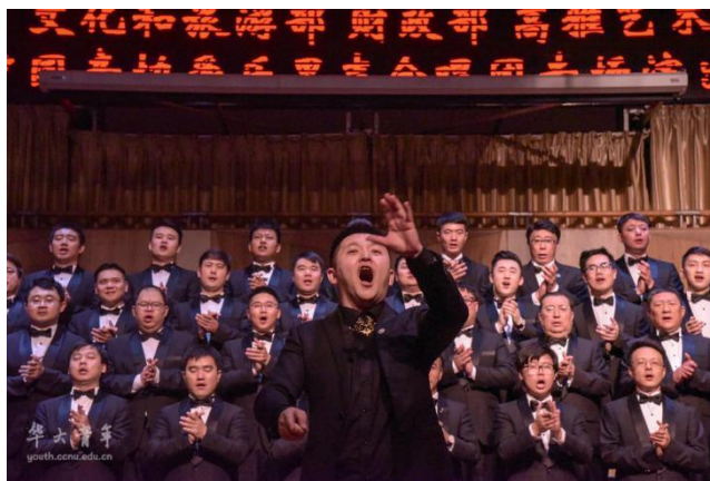
高雅艺术进校园·中国音协爱乐男声合唱团专场演出

将名师大家“引进来”，2019年我校举办“高雅艺术进校园”活动2场，邀请中国音协爱乐男声合唱团进校举办《我用歌声祝福您》专场音乐会，邀请著名古筝演奏家家、武汉音乐学院党委副书记、副院长高雁来校开展《中国古筝艺术的传承与创新》专题讲座，将高雅艺术融入校园文化建设，进一步提升校园文化活动品质，不断开阔学生视野。带学生团队“走出去”，以我校大学生艺术团为代表的学生艺术团体积极走出校园、服务社会，赴武汉方桂园社区、金泉社区、黎明社区等开展“文艺进社区”专场晚会3场，将艺术教育成果辐射到社区，反哺到社会，获得周边社区居民一致好评；组织学生参演湖北省高校“醉晚亭”大型器乐欣赏晚会，校大学生艺术团联合中南民族大学艺术团举办“毕业季 我们的声音”合唱音乐会，参演武汉马拉松文艺表演等校外活动；举办4场“校园文体沙龙”，促进大学生文体干部和艺术团体在交流中互学互促，提升美育育人实效。