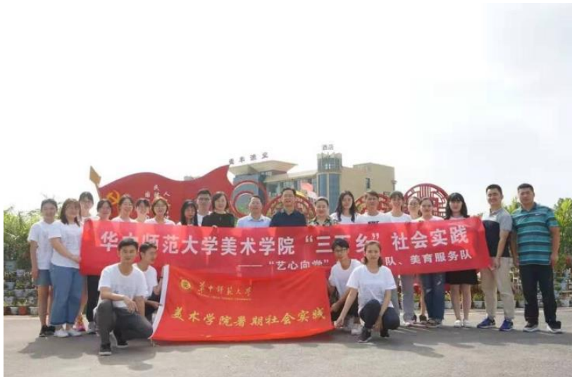
华中师范大学美术学院赴鄂州社会实践服务队