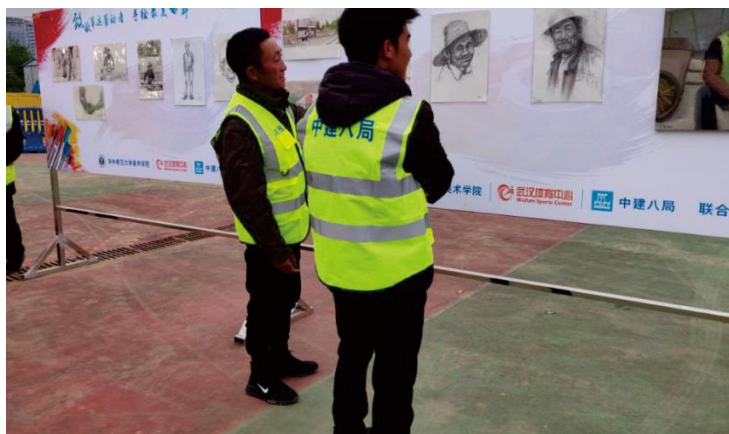
艺术进社会：手绘军运会武体中心作品展

“美术进社会”是美育节系列活动的延伸与拓展，旨在让艺术走进大众，为社会提供服务，建设社会主义精神文明和培养学生向上向善的美德。通过手绘军运会武汉体育中心作品展、美院优秀作品进附小作品展、“共赏一次美术展”主题团日活动和艺术走基层系列展览，让广大市民、在校大学生及广大中小学生，近距离感受美，欣赏美，理解美。活动中展出的作品均为美术学院学子原创，作品的形式包括油画、版画、国画等，共计 200 多幅，得到了众多观众的喜爱，获得了良好的社会反响，也为提高社会的审美素质贡献了一份力量。