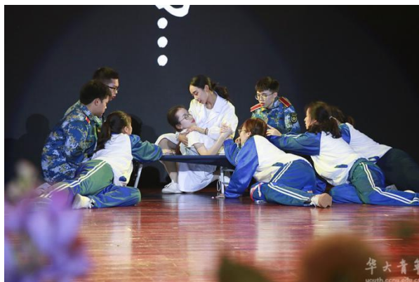
“桂子印象”校园舞蹈大赛

展演、竞赛、活动为内容。2019年举办第32届“树人杯”艺术文化节，组织开展了包括第一届校园舞蹈大赛、第一届校园原创情景剧大赛、第十五届校园主持人大赛、“艺生有你”大学生艺术团专场演出、华大艺术团民乐团专场演出、华大艺术团管弦乐团专场演出等在内的系列文艺活动30余场，场均演员和观众达500余人，累计参与15000余人次，营造了浓厚的美育实践氛围。