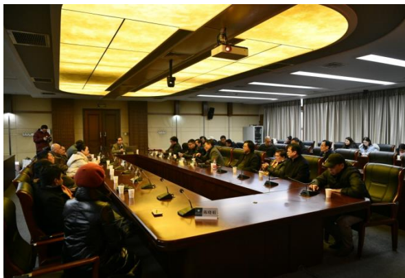
“中国画与大学：通识美术教育”学术研讨会