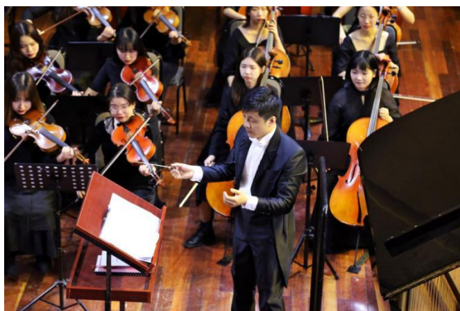
第四届桂子山音乐节闭幕式