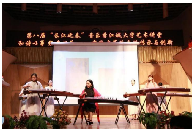
和诗以箏，经典相承——中国古筝艺术的传承与创新