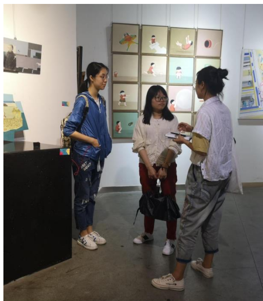
毕设创作分享会（设计专场）

毕设创作分享会不仅展示了美院学生的风采、为其他学院学生提供了走进艺术作品的机会，也在不同学院之间构建了交流平台。这次讲座让同学们深深地感受到，艺术领域的新知识，对于自身学科的发展也有启发和触动。不同学院、不同专业的同学，在思维的不断碰撞中，迸发出无限的创造力和想象力，充分体现了桂子山美育节“寓美于教、融美于学、以美育人、以美化人”的育人宗旨。