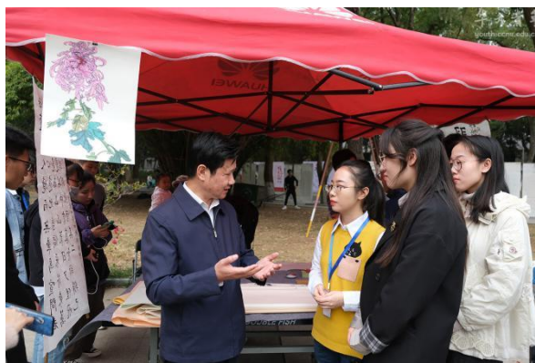
第四十一届菊展暨第十三届菊花笔会