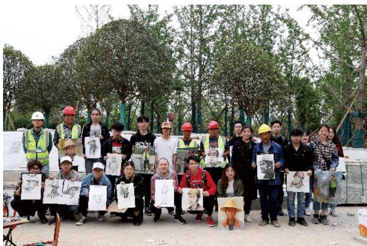
“以人民为中心”的主题创作课：为最美劳动者画像