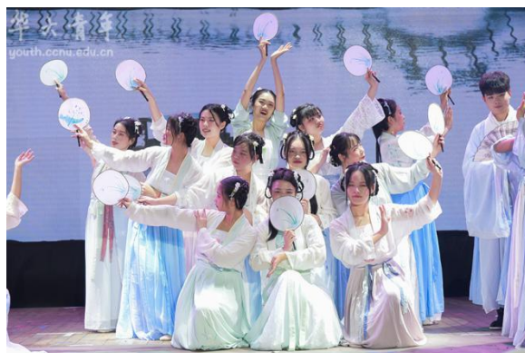
“守护时光，守候你”——华中师范大学 2019 级迎新晚会

17 个设立至今已达十年，涉及舞蹈、戏剧、音乐、美术等诸多艺术形式，当前在册会员包含艺术专业与非艺术专业学生共计 5200 余人，覆盖全校 24 个学院。2019 年，各艺术类学生社团积极参与和举办校内外艺术展演、专场音乐会、戏剧演出等各类活动 20 余场。笛箫协会的 25 周年社庆、吉他协会的民谣音乐节、晨雨剧社和文华勾沉剧社的毕业大戏《吃梦》《茉莉姑娘》、南湖书画协会的菊花笔会等活动均极具校园影响力。与此同时，相关社团在校外各大活动上也表现突出，有力彰显了我校的美育文化成果。华韵京剧社参与武汉市“戏曲进校园”活动，全年累计进入十余所中小学校举办戏曲演出及讲座；梦翔艺术协会参演武汉大学 2019 社团文化节开幕式；知音口琴社参演华中科技大学社团文化节晚会；笛箫协会参与高校笛箫联谊会，为新中国成立七十周年录制笛箫版《我的祖国》。