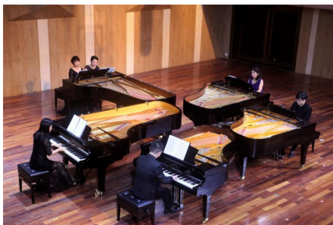
第四届“桂子山音乐节”开幕式