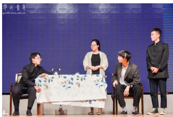
“忆百年 绎青春”情景剧大赛