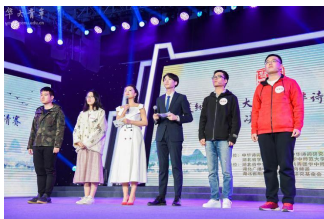
“聂绀弩杯”大学生中华诗词邀请赛

坚持以品牌影响力提升教育影响力，打造校园文化精品活动，将品牌“带出去”。2019年举办第35届湖北省高校“一二·九”诗歌散文大赛，该赛事由我校于1984年率先发起，为纪念“一·二九”爱国学生运动举办，已成为湖北省高校最有影响力的文化活动之一；举办2019年“聂绀弩杯”大学生中华诗词邀请赛，海峡两岸共计3000余名在校大学生参赛，该赛事由中华诗词学会、省学联和我校联合发起，是面向海峡两岸在校大学生开展的全国性赛事，是湖北省推动中华优秀传统文化与时代精神有机融合的重要载体。2019年承办湖北省庆祝新中国成立70周年青春诗歌会，全省各界青年代表1400余人参加，时任省委常委、统战部部长尔肯江·吐拉洪、副省长曾欣出席并高度肯定，中青报、湖北日报等媒体广泛报道；校大学生艺术团连续第七年参演央视“五月的鲜花”全国大中学生五四文艺汇演，展现我校青年昂扬风貌；协办第四届海峡两岸青年东湖论坛文艺表演等大型赛事和活动，先后覆盖师生观众近一万人。