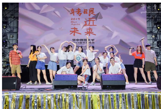
“转眼·近·未来”毕业晚会

3. 以“一二·九”诗歌散文大赛、“聂绀弩杯”大学生中华诗词邀请赛等为代表，打造美育文化活动品牌。